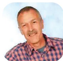
< Meester Mart (vrijwilliger Duits)